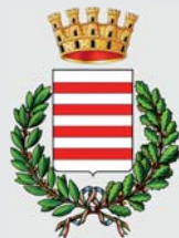
Comune di Barletta